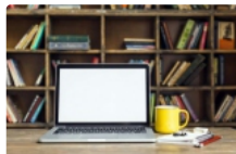
Робота з е-кабінетом вступника: помилки при реєстрації