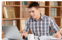
Статус заяви вступника: як відслідкувати