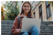
Вступникам необхідно відслідковувати статус заяв