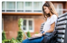
Вступникам бажано перевірити свої дані в ЄДЕБО