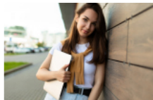
Оприлюднено проєкт Порядку прийому до коледжів у 2025 році