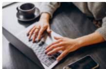
Особливості подання документів в електронній формі