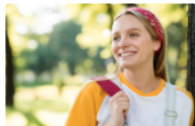
Вступ до коледжів у 2025 році: що треба знати вступнику